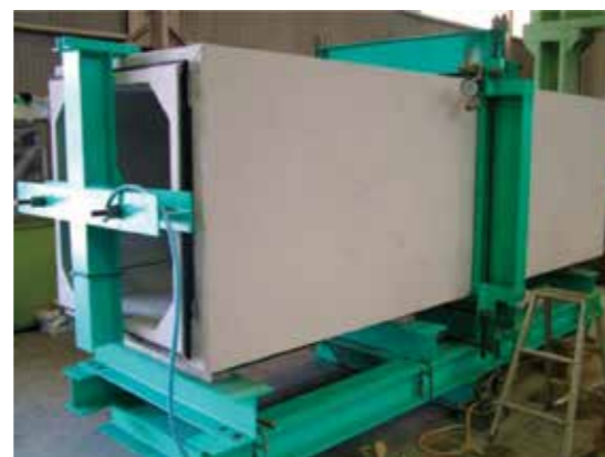
継手部水密性能試験 (ゴムリング方式)