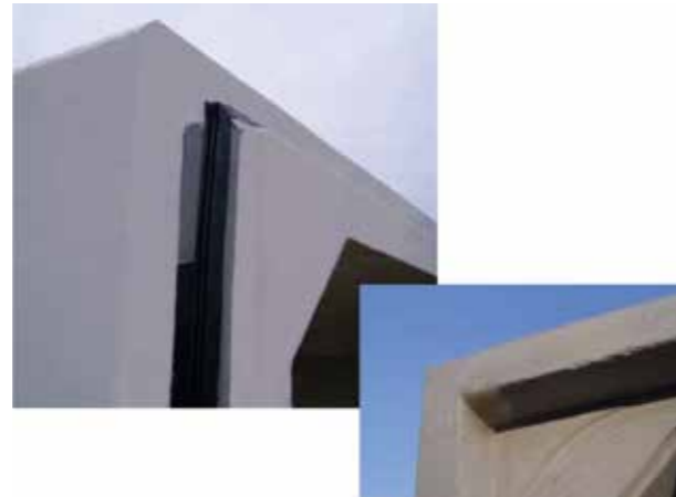
IB ボックスカルバート (IB10タイプ)